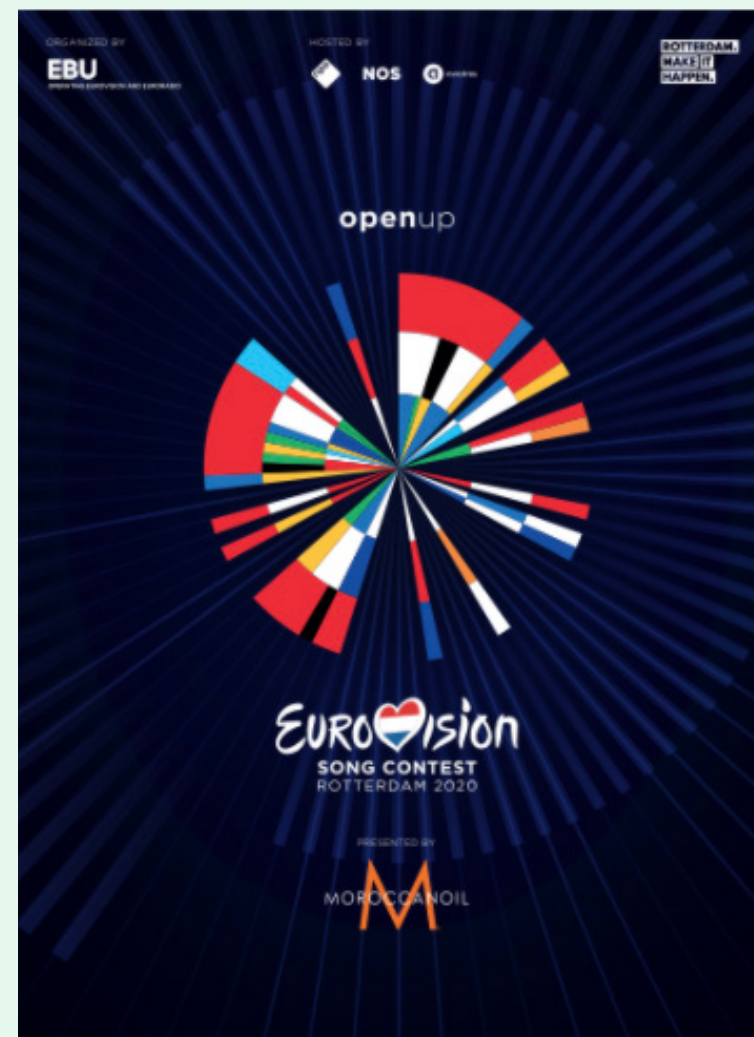
Officieel artwork ter promotie van Eurovision Song Contest. Vanuit Officiële partners.