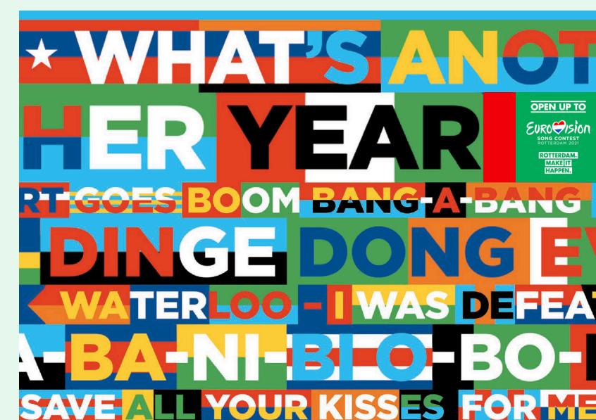
Citydressing door Studio VollaersZwart ter promotie van Rotterdam.